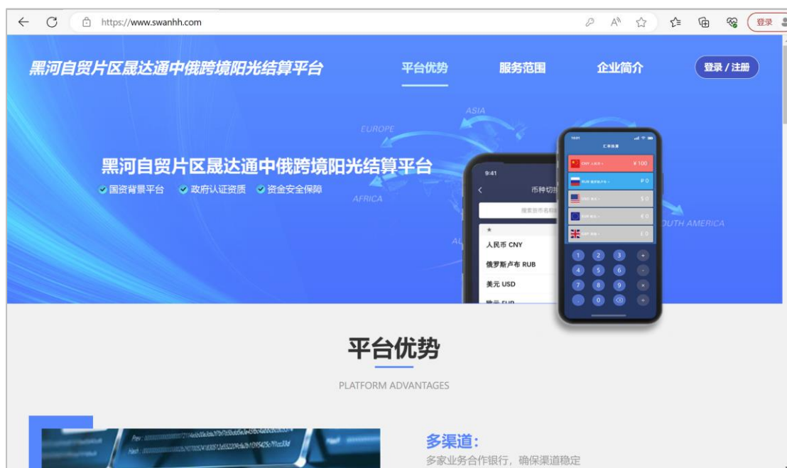
图 5：晟湾阳光结算平台首页

晟湾自主开发了中俄跨境阳光结算平台，并向黑河市自贸区备案。实际结汇中，晟湾给出口企业授权阳光结算平台的账号和密码，出口企业登录阳光结算平台实现结汇资料的提交与流转、资金的入账与转出、结汇的状态与进展的实时追踪。全流程线上办理，各环节状态可追踪查看。